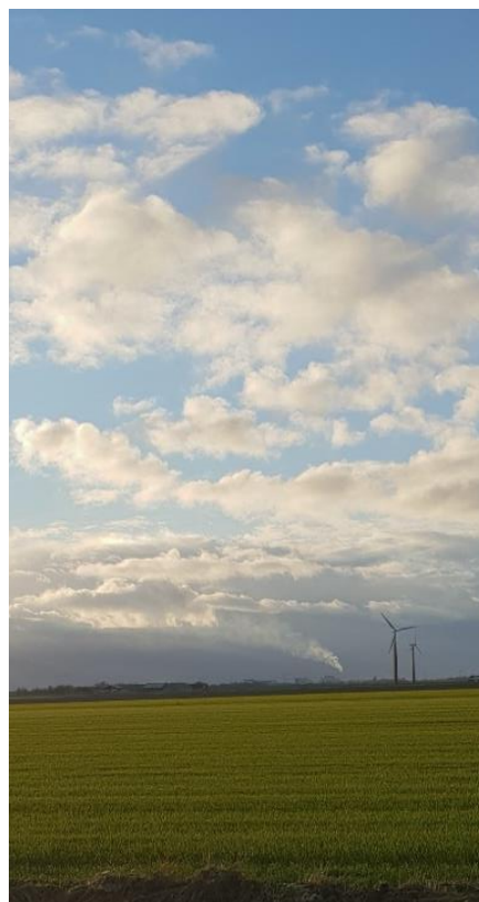
Afbeelding 1 – Pluim van afvalverbrandingsoven REC, Harlingen 2023, Nederland

Dit rapport presenteert de eerste verkennende resultaten, na 10 jaar, van dioxinen, PFAS en PAKs in biomatrices zoals eieren van hobbykippen, nu ook op groenten en fruit. In 2024-2025 wordt het onderzoek naar deze Zeer Zorgwekkende Stoffen ( Substances of Very High Concern - SVHC) door ToxicoWatch uitgebreid in de omgeving van de REC WtE verbrandingsoven in Harlingen naar andere biomatrices en tevens op de aanwezigheid van zware metalen.